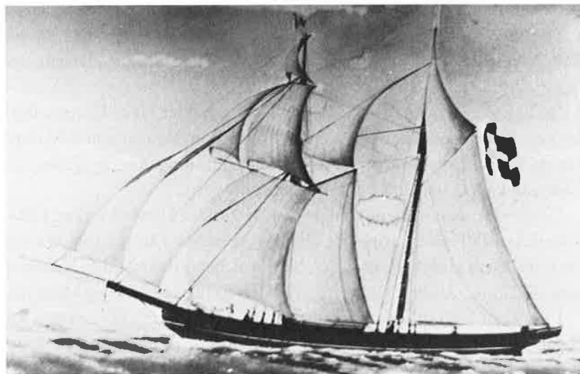
Skonnerten »Gefion« af Nyborg. Bygget 1852, solgt 1897. Nyborg Museum.