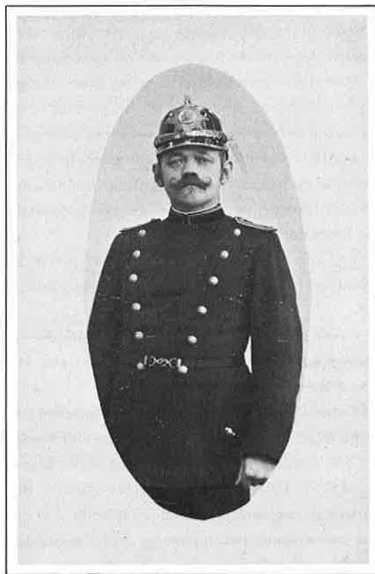
En af byens politibetjente.

For hver enkelt kategori af de ansatte personer blev der udarbejdet instrukser angående tjenestens pligter og indhold. Generelt havde personalet »med flid, omhu og nøjagtighed at efterkomme enhver dem af deres foresatte given ordre, gøre sig nøje bekendt med byens lokaliteter og dens beboere, våge over at den offentlige ro og orden opretholdes og gøre anmeldelse om enhver lovovertrædelse, der måtte komme til deres kundskab«.