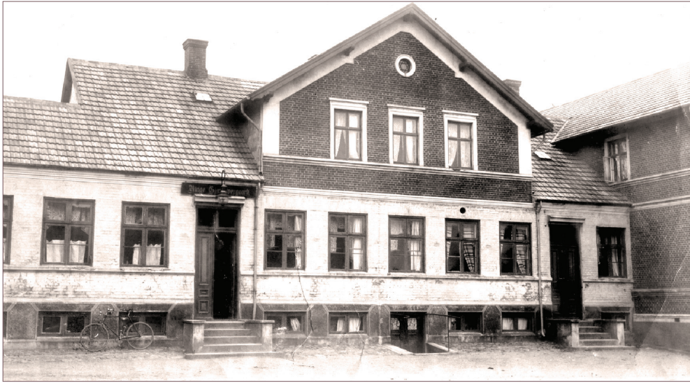
Ringe Gæstgivergaard, som dannede ramme om de dramatiske begivenheder i sommeren 1885. Billedet er fra ca. 1910. Ringe Gæstgivergaard eksisterer ikke mere.

stensen meddelelse til kredsene om den givne tilladelse. Nogle kredse opfattede meddelelsen som en opfordring til at genoptage skydningen, mens de fleste andre forholdt sig afventende, da de ikke vidste, hvad dette skulle sige; Nielsens og Christensens meddelelse findes desværre ikke mere, så vi kan ikke sige, hvad der fik kredsene til at stoppe op og afvente begivenhedernes videre gang.