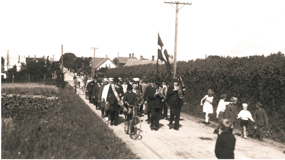
Haarby Skytteforening med flyvende fane og klingende spil på vej til fugleskydning omkring 1915. Selvom skytteforeningernes hovedaktivitet var baneskydning, arrangerede mange foreninger også fugleskydninger som festlige indslag.

og medlemskab af en riffelforening og erklærede, at skulle det komme dertil, at riflerne blev brugt til ulovlige øjemed, ville han ikke være med længere.