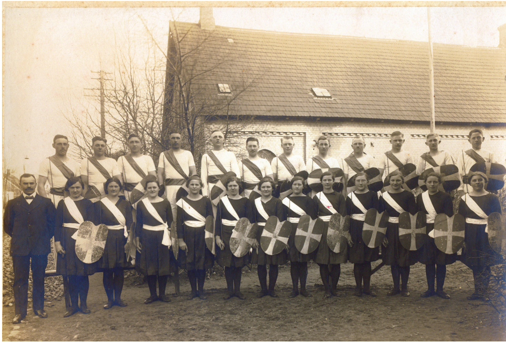
Et skjolddanserhold opstillet til fotografering i 1919. Skytteforeningernes kvindelige medlemmer fik først i 1908 status som aktive medlemmer.

af de første 22 fynske øvelshuse kom i Svendborg Amt. 4 For at få svar på det spørgsmål skal vi vende blikket mod en anden af 1800-tallets store bevægelser, Vækkelserne .