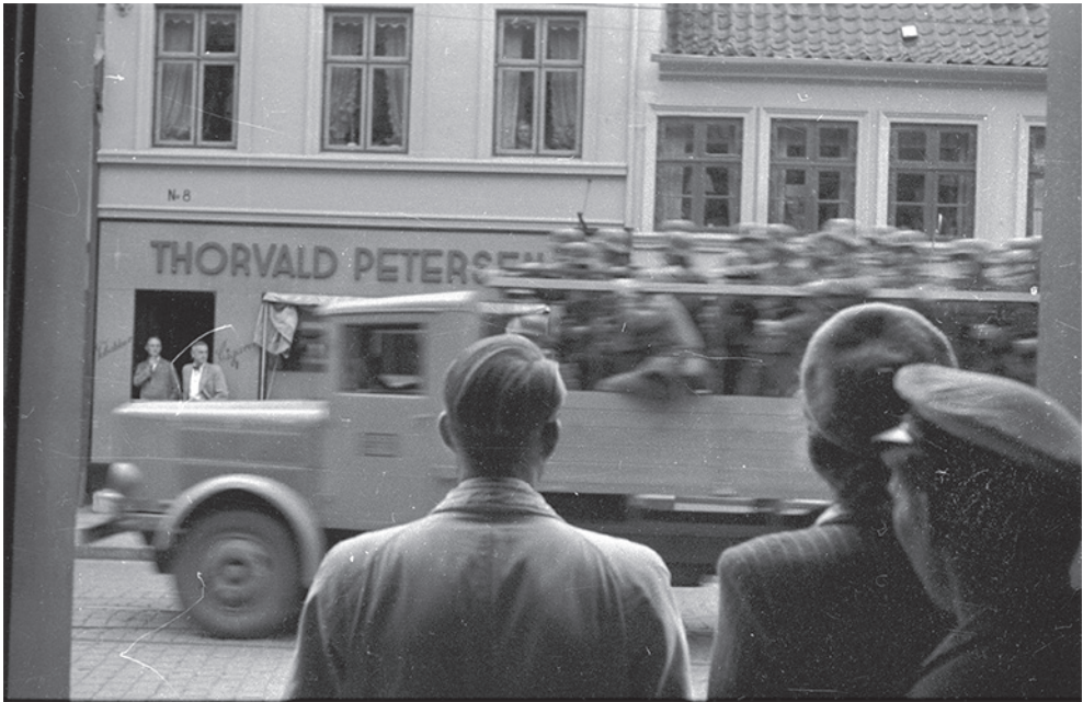
I 1943 fandt augustoprøret sted bl.a. i Odense. Her kører en lastbil med soldater gennem Odense.