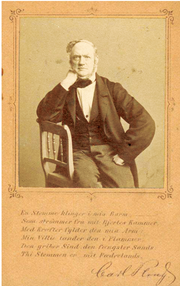
Carl Ploug (1813-1894), digter; journalist og politiker. Ploug hyldede Grundtvig for at have givet almuen del i de dannede klassers højere oplysning. Men det var slet ikke Grundtvigs mening. Han mente, at almuen oplysning måtte udspringe af almuen egne erfaringer.