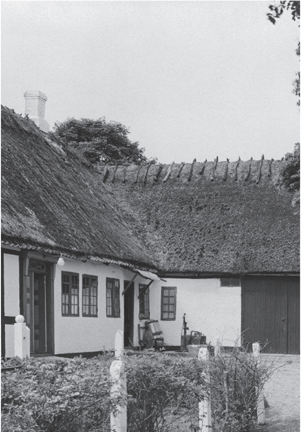
Bygningen på Ryslinge mark, hvor Christen Kold i 1851 startede sin første skole for unge.