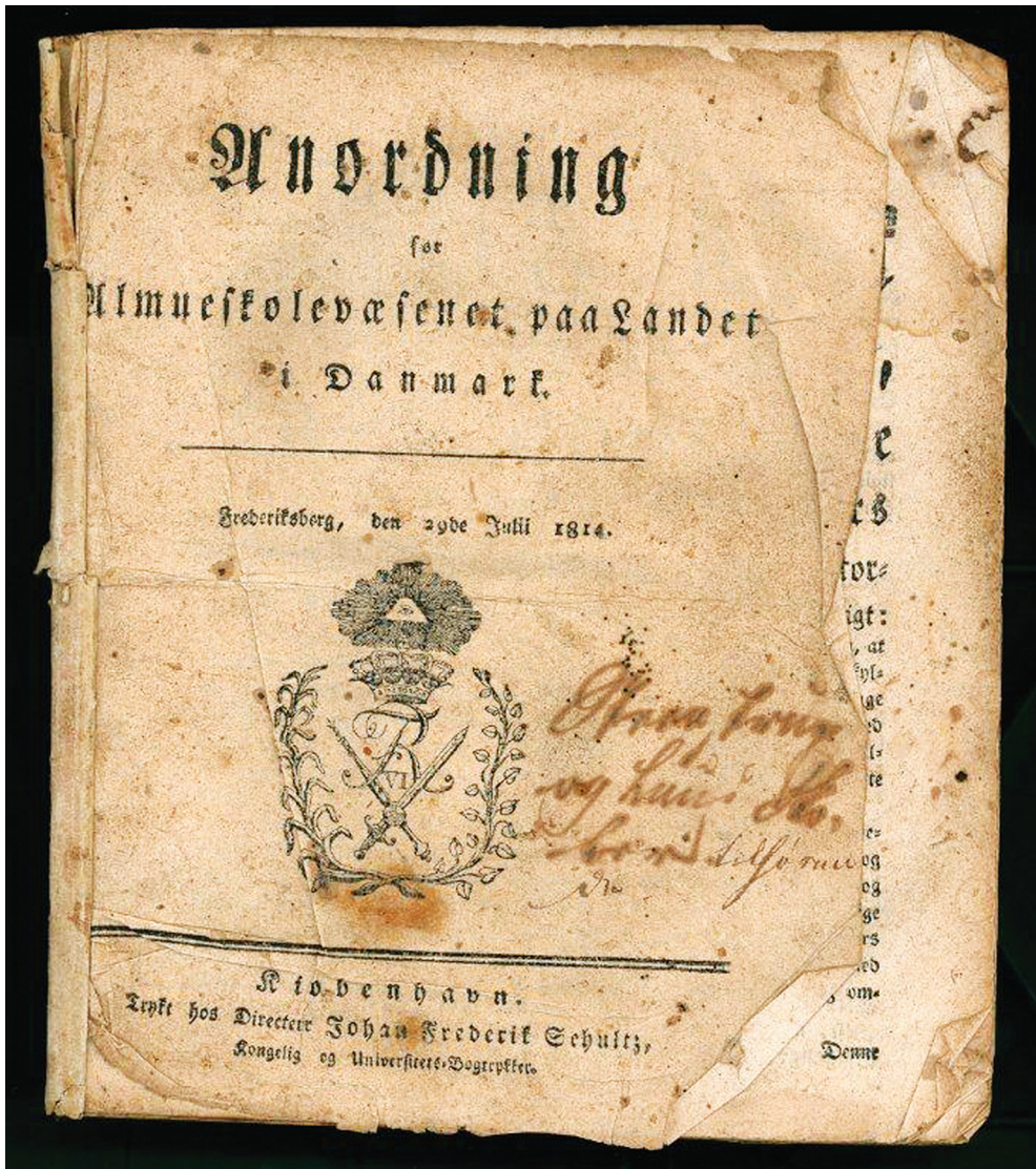
Skolelovene af 1814 blev skelsættende for udviklingen af det danske skolevæsen. Efter statsbankerotten og tabet af Norge var det også påkrævet med reformer, der pegede fremad.