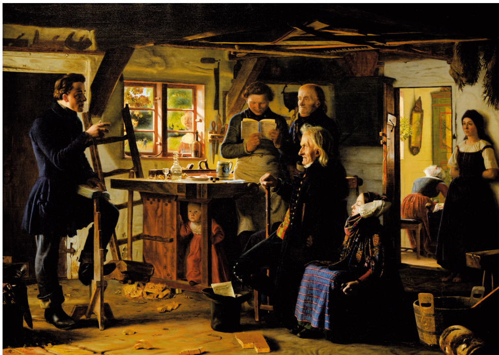
Mormoner på besøg. "Tvende Mormonere ere paa deres Vandring komne ind i et Tømmerhus paa Landet, hvor de ved Prædiken og ved Fremvisning af nogle af deres Sekts Skrifter søge at vinde nye Tilhængere", skrev maleren Christen Dalsgaard på sit billede. Trods mormonerne og især baptisternes mission i 1850'erne forblev hovedparten af de vakte inden for den rummelige folkekirke, hvor de bevarede deres særpræg med tilknytningen til bedehuse/missionshuse.

Lykke". Først dannede han en højskole i Ryslinge i 1852, hvor bønderkarle netop under inspiration af historien og poesien kunne blive trukket op – som fjederen i et ur. Allerede i 1853 flyttedes højskolen til Dalby ved Kerteminde. Tilstrømningen var stærk, og det blev i 1862 nødvendigt at flytte højskolen til Hjallesø.