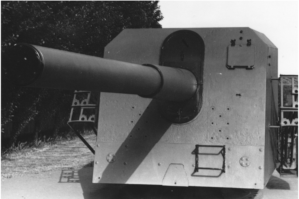
Skydning med fortets kanoner gav problemer med de radikale husmænd omkring fortet. Det førte til et stop for skydningen med kanonerne og etableringen af to nye kanoner helt nede ved vandet, også kaldet det "radikale strandbatteri".

problem for mennesker og dyr i nærområdet. 11