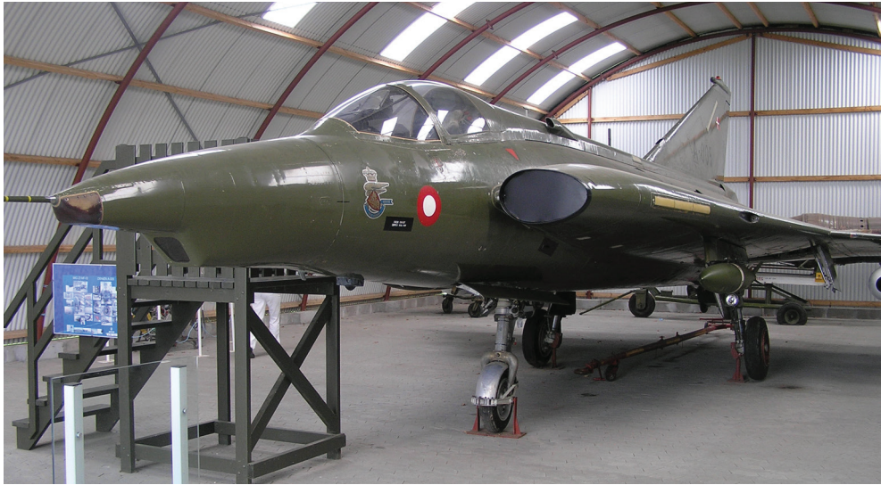
De danske Draken-fly foretog rekognosceringsflyvninger over danske farvande og Østersøen og bidrog således med vigtig viden om de østlige flådeaktiviteter omkring Danmark.