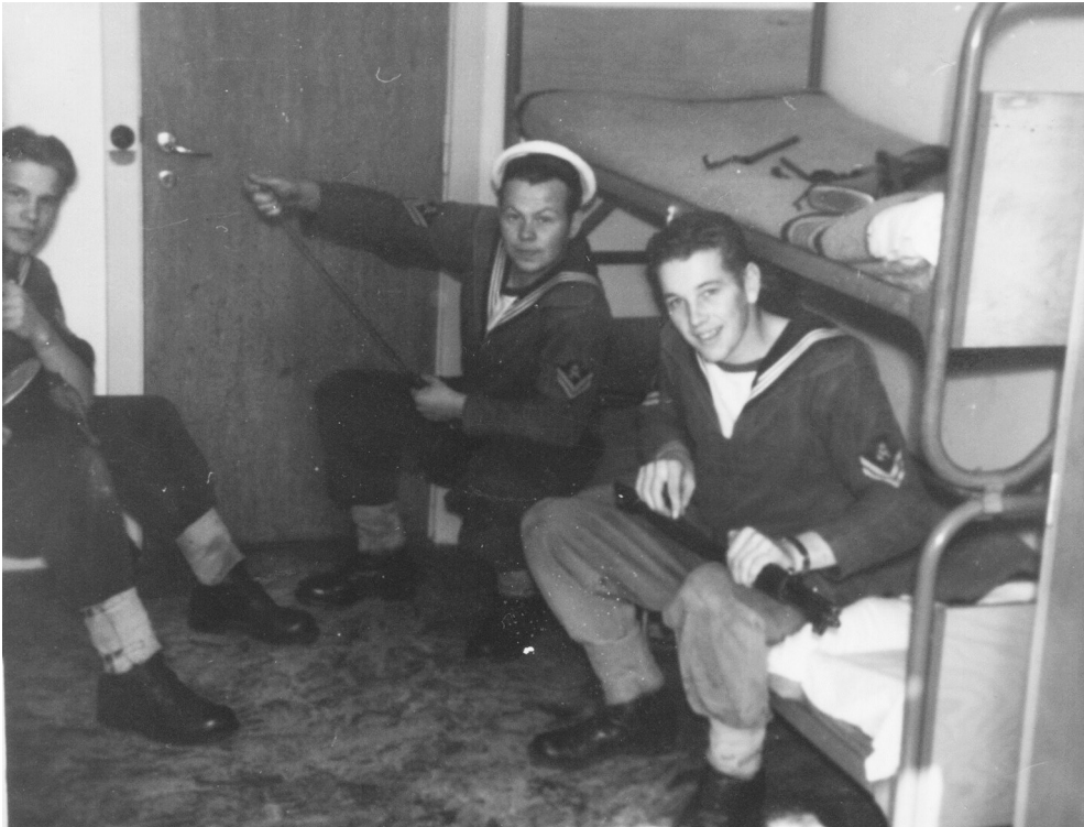
Gevæerne klargøres med et smil på læben. Smilet fortrak sig i oktober 1962 under Cuba-krisen.

brugt i forbindelse med øvelsesskydninger i de kommende år. Nu blev fortets fire kanoner suppleret med det såkaldte radikale batteri.