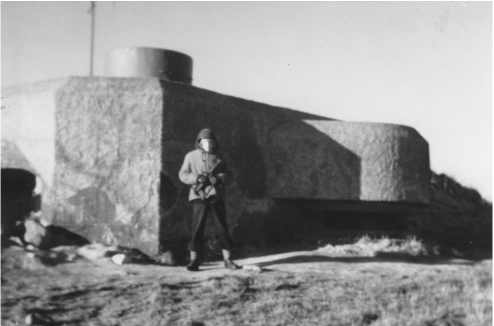
Vagtpost ved en af de mindre kendte bunkers på Langeland tæt på Marinens Udkigsstation. Den dag i dag er bunkeren ikke tilgængelig, men ligger inde på militært område.

vikle Langelandsfort som en national og international udkigspost til historien.” Det er målet med det formaliserede samarbejde mellem SDU og Koldkrigs-museum Langelandsfort at sikre et højt fagligt niveau i museets formidling af Den Kolde Krig, ligesom SDU’s forskere og studerende får mulighed for at indgå aktivt i museets historiske formidling og forskning.