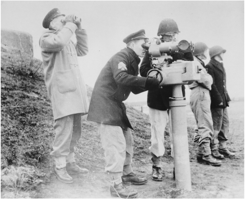
Hektisk aktivitet ved luftværnsstilling Nord, hvorfra man skulle holde sig orienteret om, hvad der foregik omkring fortet.

”En uge i korpset var jo sådan, at vi mødte mandag morgen kl. 7, hele natten imellem tirsdag og onsdag var der natøvelse. Hvis vi kom hjem kl. 6.30, jamen så begyndte vi kl. 7 alligevel. Det var der også natten mellem torsdag og fredag, det vil sige to nætter om ugen fik du faktisk ingen søvn, og vi arbejdede til lørdag kl. 14 dengang. Vi snakker stadig om 1957, og nogle gange når vi så alligevel skulle til bal om lørdagen, for det skulle man jo, det sagde alderen næsten at man skulle, så ved jeg, at mange, mange, mange af os vi gik hjem, når klokken var 23 eller sådan noget lignende. Så var der simpelthen udsolgt. Og så sov du hele søndagen, og så kunne du begynde igen om mandagen.”