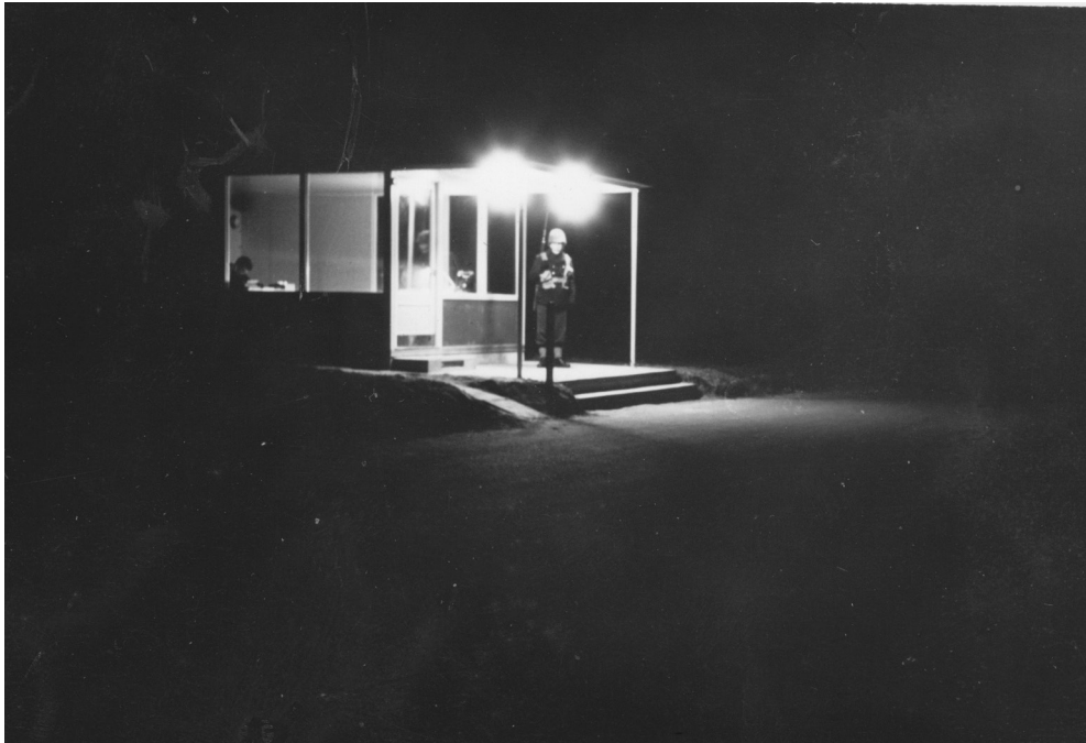
Den bevæbnede vagtpost ved Holmegaards kaserne var det første, man mødte, når man kom til fortets område.