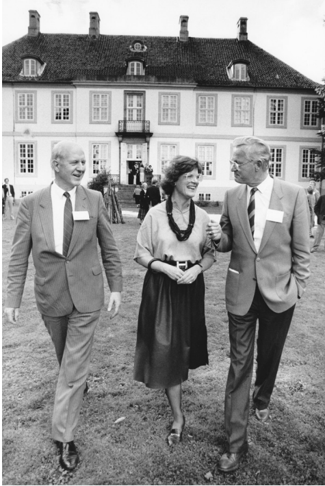
De europæiske landbrugsministre besøger landbrugsminister Britta Schall Holberg på Hagenskov under det danske EU-formandskab (1987).