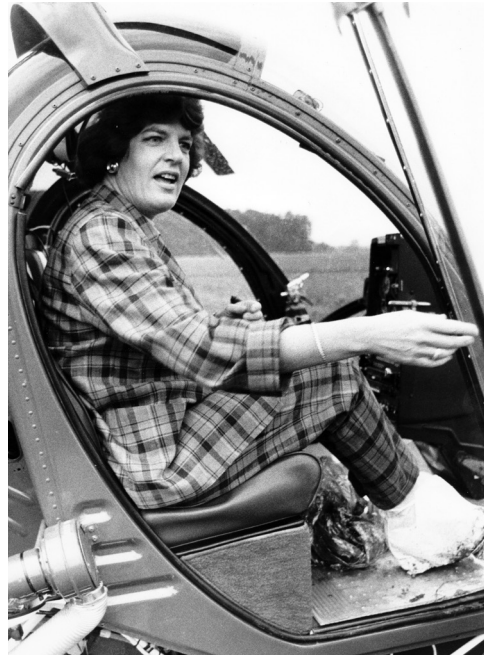
Landbrugsminister Britta Schall Holberg besøger ærtemark ved Svendborg (1987).