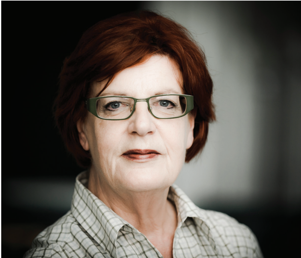
Britta Schall Holberg, 2010.