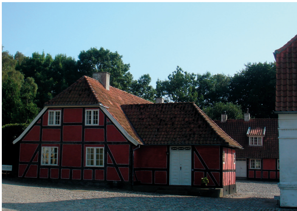
Mellem 1741, da slotsgården Frederiksgave brændte, og 1775, da det nyklassicistiske anlæg stod færdig, blev Frederiksgave Gods administreret fra disse beskedne bindingsværksbygninger, der ligger som et lille fint bygningsanlæg ved de nuværende driftsbygninger.

derkarles flugt fra Frederiksgave Gods med påfølgende rømningsdom.