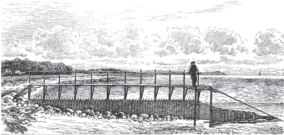
Ålegård omkring 1900. De ålegårde, der nævnes på Helnæs 200 år tidligere, har været væsentligt enklere og uden gangbro foroven.