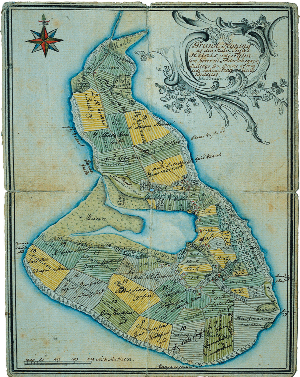
Udskiftningskort over Helnæs 1769 viser også bebyggelsen på Helnæs i 1723, da alle gårde og huse var samlet i landsbyen, bortset fra fogedgården Bogården (oprindeligt Langørso), der blev bygget ved dæmningen til Agernæs i 1546.