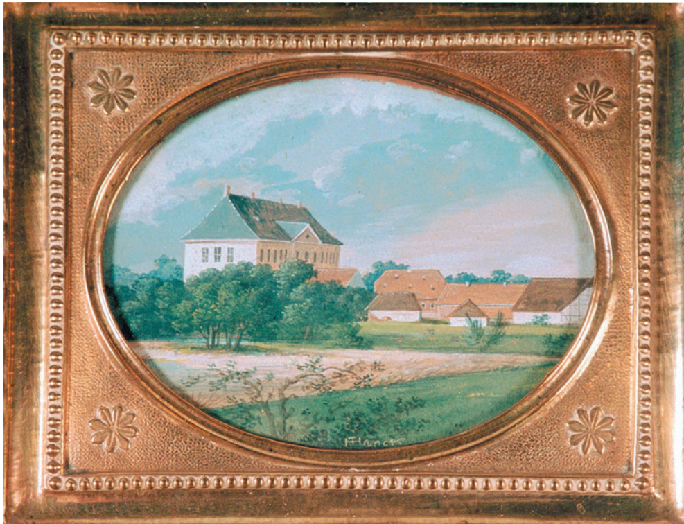
Frederiksgave 1889 – på det tidspunkt, da et par isvintre gav mulighed for omfattende smugleri til og fra Als. Se side 119. Malet af J. Hanck i 1839, gouache, Kilde: Odense Bys Museer.

at af dommeren Matte paa Raabes om Nogen af de Hellenis Mend, huus Mend og Inderster er til steede for at viedne og forklare deris Sandhed efter afvigte 18 decembr. indførte kald og varsel og scheede foreligelse, og efter at Eden lydeligen af Retten for Samptlige tilstede verende vidner var oplæst, fremstod Søren Ibsen Inderste paa Hellenis. Bang til Spurde vidnet først huor mange aalegaarder og Ruser der nu virchelig er og an-hæfter til Hellenis Land, huor til vid-net svarede ungefehr en 26 = for det andet hvem Samme har sat og bygt, eller ladet sætte og opbyge, huor til vidnet svarede efter følgende har la-det sette og opbyge aalle gaarde...” 7 og herefter opremser han navnene på