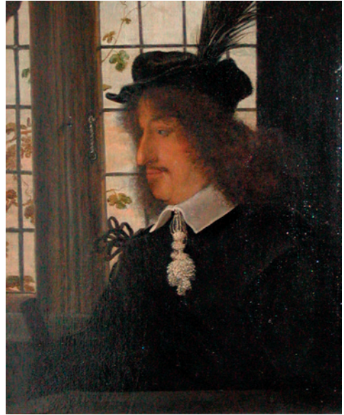
Det var Frederik 3., der reformerede lensadministrationen, hvilket i 1662 førte til oprettelsen af amterne.

Som led i reformarbejdet blev lenene ved forordning af 19. februar 1662 omdannet til amter (efter ty. amt = embede), og indholdet i embedet blev samtidig nydefineret. Ikke blot navnet på det nye forvaltningsorgan var tysk, men kongen og hans rådgivere havde desuden i det nordtyske hentet inspiration i moderne forvaltningspraksis, ligesom der i hele den enevældige tankegang lå et ønske om at centralisere magten i København. Resultatet blev, at den nye amtsadministration i forhold til lensadministrationen blev ændret betydeligt, til at være mindre omfattende og med en reduceret liste af arbejdsopgaver. Således blev amtmændenes rettigheder over for købstæder og kirke kraftigt indskrænket, og retten til at udnævne underordnede embedsmænd blev centraliseret i hovedstaden. Skatteopkrævningen blev overladt til en separat embedsmand, nemlig det nyoprettede embede som amtsskriver (senere benævnt amtsforvalter), som var direkte underlagt centraladministrationen. Desuden blev den militære myndighed heller ikke overladt til amtmanden, men undergik også en centralisering. Kong Frederik 3.s definition af en amtmand var således en civil embedsmand, der skulle være kongen tro og sikre enevælden lokalt og ellers fungere som øverste regionale forvaltningsled. Den meget selvstændige lensmand var dermed blevet afløst af en loyal embedsmand. Som en undtagelse overlevede amtmanden enkelte steder