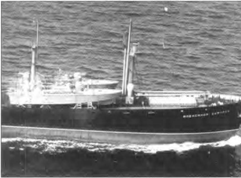
Det sovjetiske skib Alexandra Suvorov bragte torpedobåde til Cuba, men påkaldte sig inden da det danske luftvåbens opmærksomhed.

oner stammede fra området omkring Bagenkop, så kom det fynske område alligevel til at spille sin prominente rolle i en af den kolde krigs mest alvorlige kriser. Cubakrisen var imidlertid ikke det eneste tidspunkt, at den kolde krig og den efterretningsaktivitet, der fulgte i halen på den, kom til at berøre Fyn. Den kolde krig var nemlig en globaliseret konflikt, langt inden snakken om det globale skulle blive moderne. Det betød, at den i lige så høj grad udspillede sig i Odense som i Odessa.