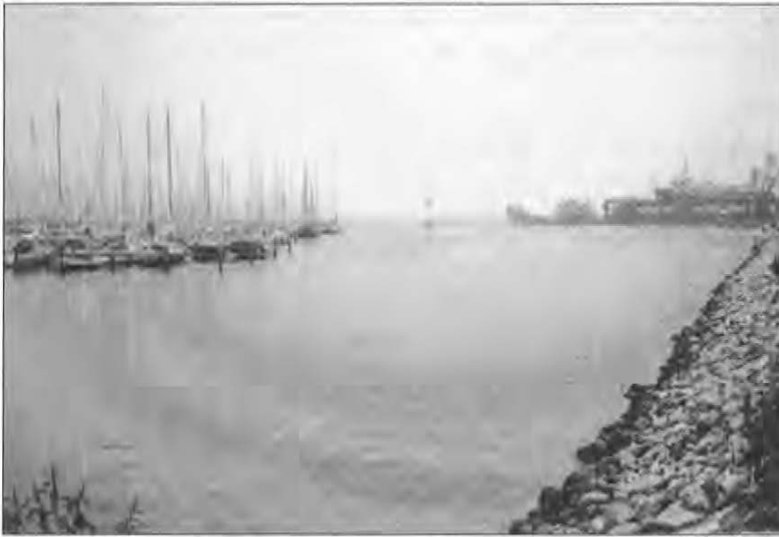
Assens havn var en af de fynske havne, som de østlige efterretningstjenester holdt øje med. Billedet er taget i 1988 af østtyske agenter. (Forsvarets Efterretningstjeneste)

hvor besætningerne var uddannede efterretningsofficerer med specifikke ordrer om at indhente en række informationer under opholdet i danske farvande. På en sådan lystbåd havde man eksempelvis »fastslået muligheden af at basere og udruste havnene i Faaborg, Svendborg, Odense og Holbæk.« 10