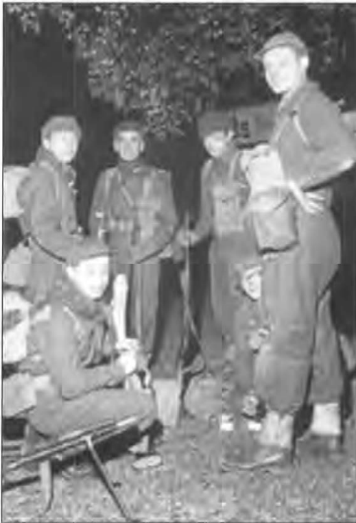
Hjemmeværnet etablerede særlige kamp- patruljer, der dels kunne overvåge, dels bekæmpe en østlig besættelsesmagt. (HJV)

lons aktion mod de fynske studerende havde givet genlyd over hele landet og havde med al tydelighed vist, at den kolde krig blev kæmpet på alle fronter og var at finde alle steder.