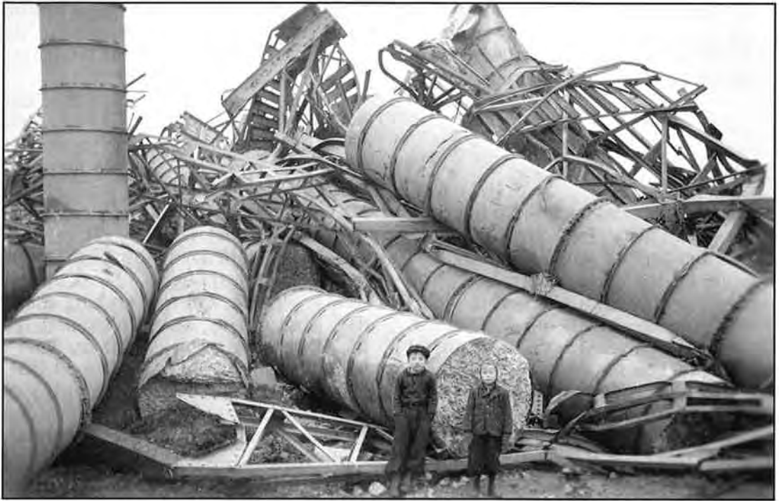
Resterne af Odinstårnet efter Peter-gruppens schalburgtage den 14. december 1944. Det 175 meter høje tårn blev indviet i maj 1935, og var i sin levetid et populært udflugtsmål for fynboerne.