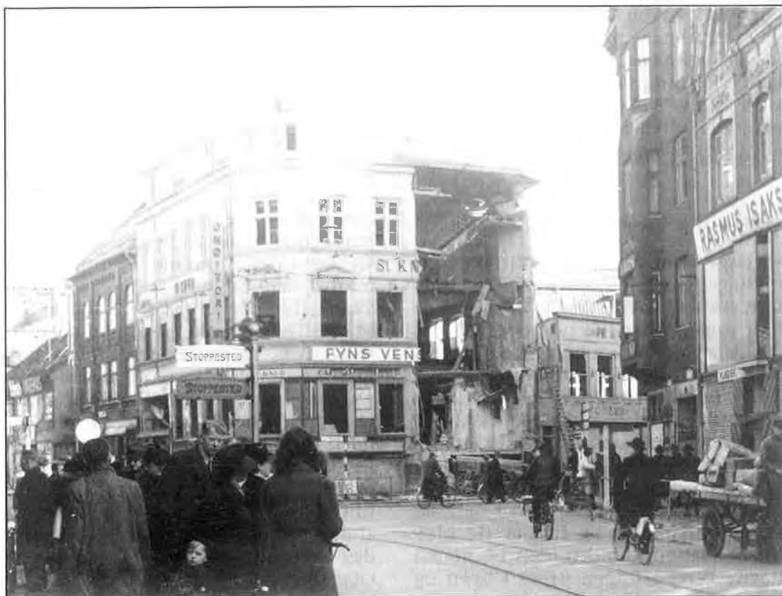
Bygningen på hjørnet mellem Mageløs og Vestergade husede bl.a. Fyens Venstreblads redaktion, konditoriet Sct. Knud og Normanns Forlag. Her ses ødelæggelserne efter schalburgtagen den 21. februar 1945.