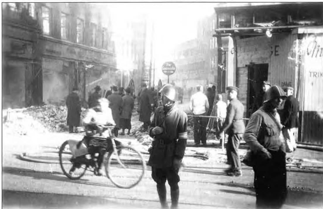
Hjørnet mellem Kongensgade og Slotsgade efter Peter-gruppens bombeattentat den 21. februar 1945.