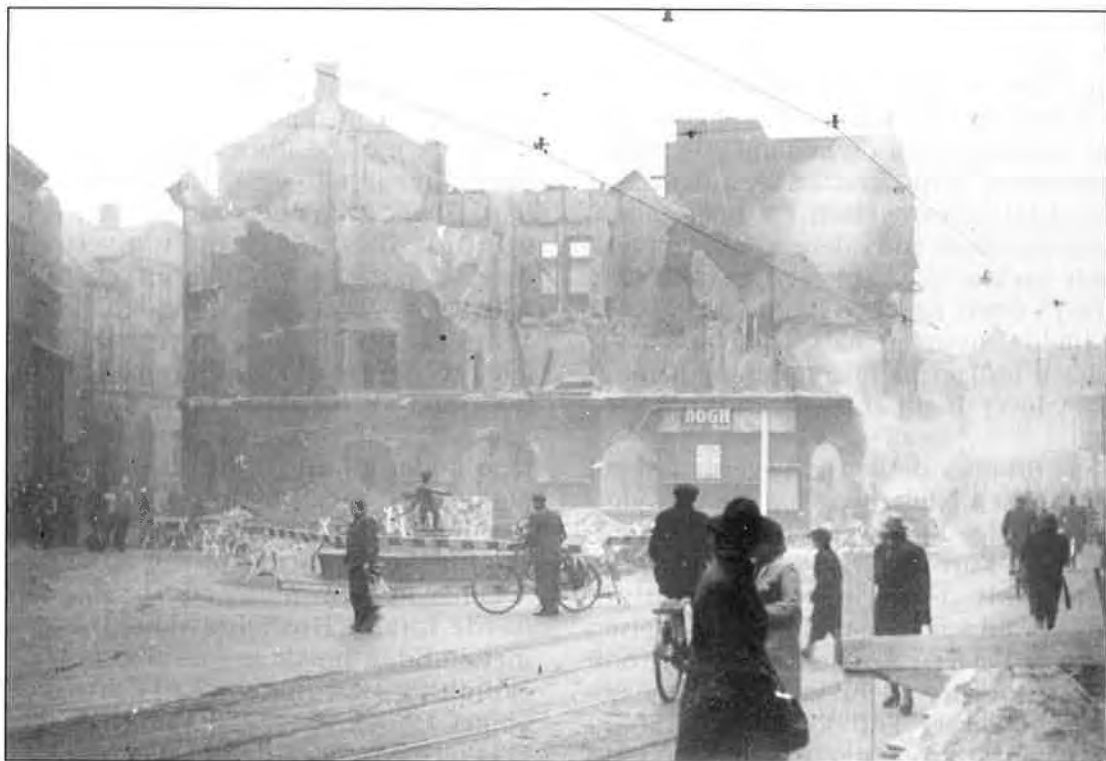
Fyns Tidendes bygning på Nørregade ved Fisketorvet efter bombesprængningen den 21. februar 1945. Venstreavisen, som var kommet til verden 1872, havde ved 2. verdenskrigs afslutning udviklet sig til Fyns dominerende dagblad.

dommen, hvis han havde forsøgt at få Ostenfeld med sig. 43