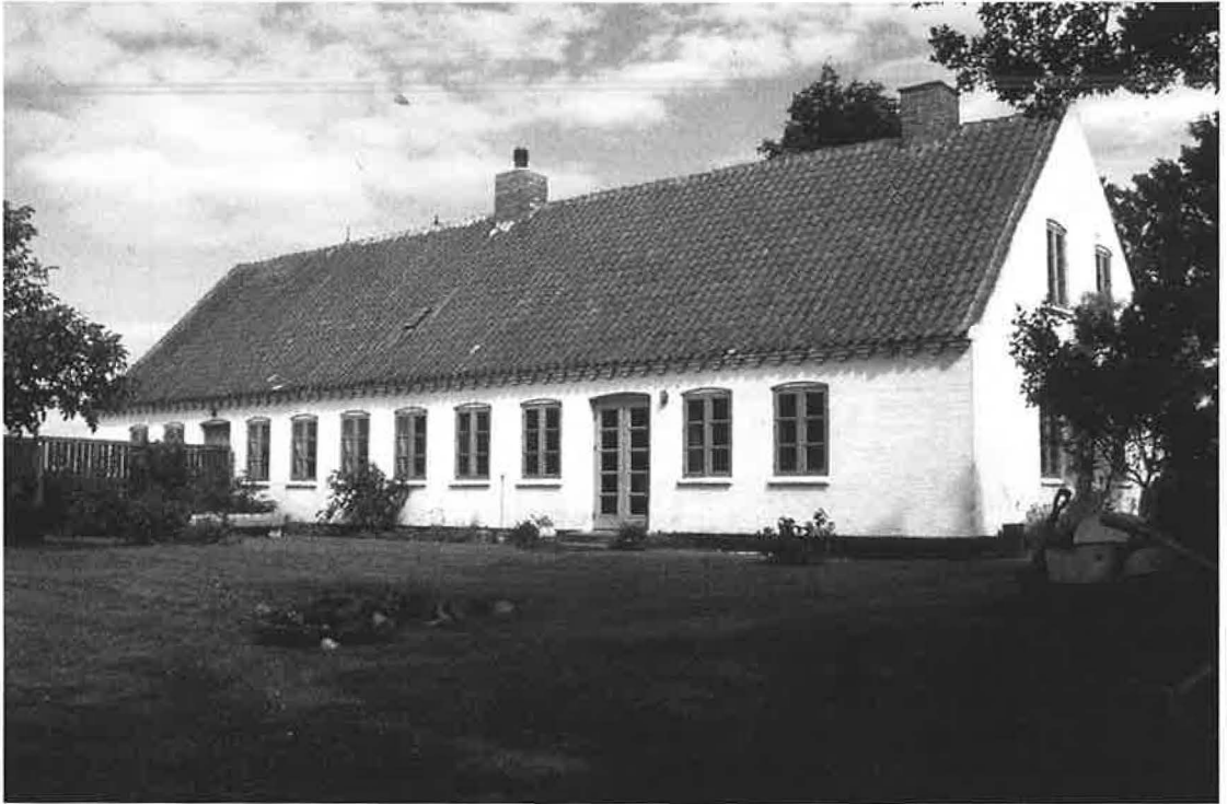
Det nye fattighus i Brandsby. Bag hegnet til venstre er der en døråbning tilsvarende den synlige. På husets modsatte side er der også to døre. De fire døre har været forbundet med to gange, hvorfra der var adgang til et større antal selvstændige beboelser. Der har oprindeligt været en tredje skorsten.