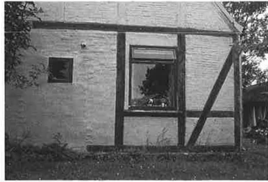
Stuehuset i Blandebjerg er en bindingsværksbygning, hvorpå der, før huset blev en del af fattiggården, blev bygget en grundmuret kvist. (Foto: Langelands Museum).