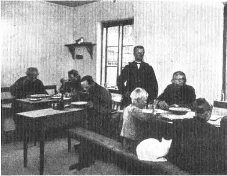
Såvidt vides, findes der ingen billeder fra Humble fattiggård eller af dens beboere, men der kan meget vel have set ud som på dette billede fra Kværkeby fattiggård.

for den stadig voksende gruppe af fattige besiddelsesløse.