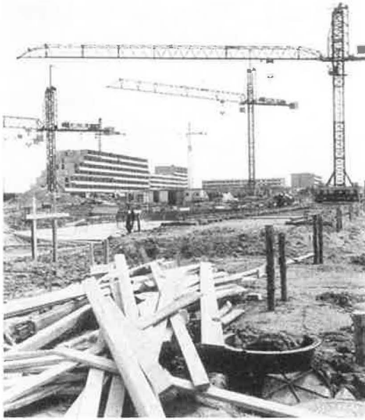
Lærkeparken i Vollsmose under opførelse 1967-69.

Lossepladsen ved Tornehøj er et kapitel i renovationsvæsenets historie, et kapitel der strækker sig tilbage til 1891. Fra 1. januar 1888 blev natrenovationen besørget ved kommunal foranstaltning, sorterende under Markudvalget. Latrinen blev hentet i tønder, og »produkterne« blev solgt til landmændene. Der var tre varetillbud, den rå latrin, eller en kompostgødning, der bestod af en blanding af latrin og dagrenovations produkter og endelig ren hestegødning. Omkring 1890 faldt efterspørgslen, og samtidig steg affaldsmængderne, så den kapacitet, i form af vogne og heste man havde, ikke kunne rummes på Snapind (lå ved Snapindvej, nuværende Stadionvej). Markudvalget mente, at en af årsagerne til det faldende salg og dermed de mindre indtægter kunne være, at man kun havde fyldingsplads i den vestlige del af byen og foreslog så at anlægge en fyldingsplads i den østlige del af byen, bl.a. for derved at trække bønderne i dette område til sig som kunder.