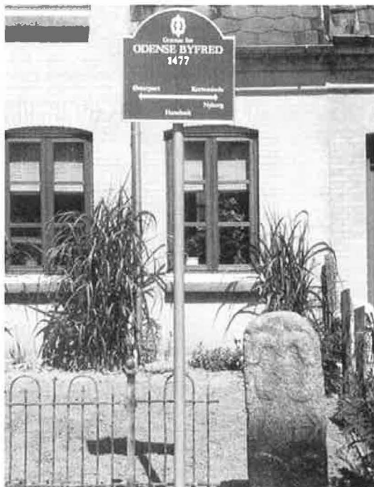
Byfredstenen i Sct. Jørgensgade (Foto: Bjarne Mortensen 1988).

De første mange år havde den leveret tørv til de omkringliggende gårde, men da udenlandsk brændsel, kul, koks og briketter vandt indpas i sidste århundrede, gik tørveskær af mode. Det fik dog