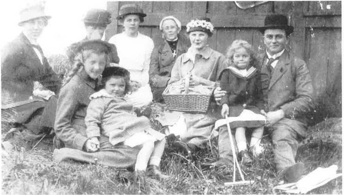
Familien Blumensaadt fotograferet ca. 1910 ved deres sommerhus ved mosen. – Bl.a. deres grundstykke skulle senere indgå i det store boligbyggeri i Vollsmose. (Privateje)

og harer, ikke mindst til glæde for de tre lodsejere der var ivrige jægere.