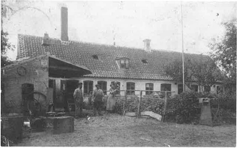
Smedjen i Ravnebjerg, fotograferet i 1917.