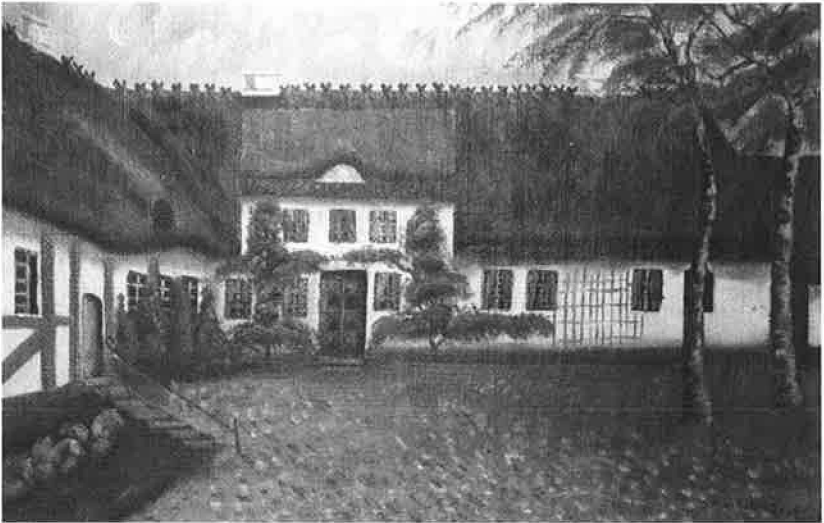
Dalum gamle præstegård, nedrevet 1926. (Efter maleri).