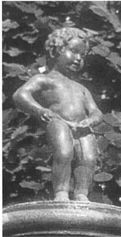
Til venstre Manneken-Pis i Bruxelles, hvortil der meget langt tilbage i tiden har været knyttet tradition med en tissende dreng. – Til højre Manneken-Pis i Bogense, hvor han holdt sit indtog i 1934.

tøj på. Det ældste kostume skal Manneken have fået i 1698. Siden er det blevet til mange. Af eksisterende kostumer, der opbevares af bymuseet og er udstillet, findes der ca. 400, hvoraf 2 stammer fra 1700-tallet og 4 fra 1800-tallet. Der kommer hvert år flere til, og flokken af iklædte Manneken-statuer på udstillingen giver et broget billede af soldateruniformer, folkedragter, beklædninger knyttet til forskellige erhverv, sportsbeklædninger m.v. Over en tredjedel er gaver fra udlandet. Når en delegation aflægger officielt besøg, hører det sig til at have en gave med, og mange er kommet på den idé at tage en dragt med til Manneken. Listen, jeg har set, stammer fra midten af firserne, og indtil da er der ingen fra Danmark, der har begavet Manneken med tøj. Skulle en gruppe bogensere engang komme på officielt besøg i Bruxelles, var det måske en idé at tage en miniature-model af en nordfynsk folkedragt med – som en hilsen fra den anden by på kloden, der har en Manneken-statue.