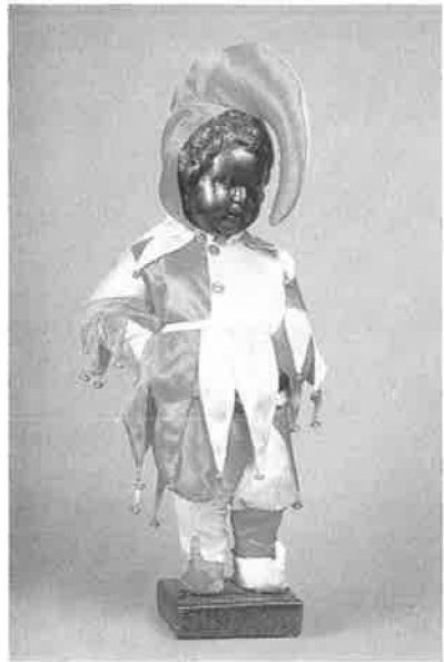
I Bruxelles er der tradition for at iføre Manneken kostumer af forskellig slags. Til venstre Manneken som musketer, til højre som nar. De to kostumer er skænket byen i henholdsvis 1956 og 1962.

1933 modtog byrådet en henvendelse fra konsul Willum Fønns, der meddelte, at han – såfremt man ville tage imod det – ville skænke byen en gengivelse af den kendte Manneken-Pis i Bruxelles. Bogense Avis kunne give meddelelsen den 19. oktober, og dem, der ikke havde hørt om statuen i Bruxelles, kunne man fortælle følgende: »Manneken-Pis forestiller en allerkæreste splitternøgen lille buttet gut, der nok så naivt og frejdigt forretter sin beskedneste nødtørft. Originalen i Brüssel er både morsom og uforargelig i al sin naive åbenhjertighed«.