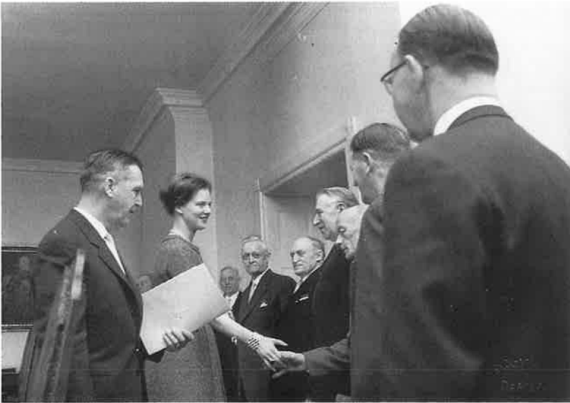
Som et led i sin uddannelse opholdt tronfølgeren sig i tresserne nogle dage på Odense slot for at blive sat ind i arbejdet i amtsrådene og på amtsrådskontorerne. Her præsenterer den fynske stiftamtmand tronfølgeren for medlemmerne af Odense og Assens amtsråd.