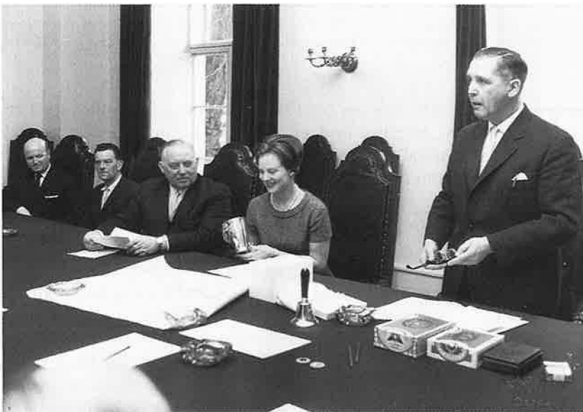
Tronfølgeren får overrakt et sølukrus med amtsrådenes våben.