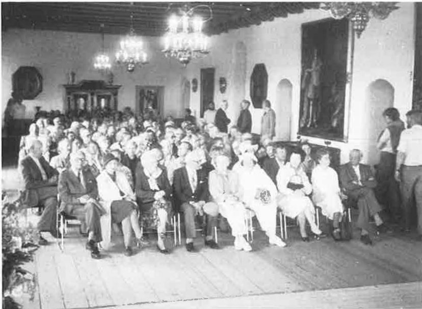
Historisk Samfund på udflugt til Egeskov i maj 1986.