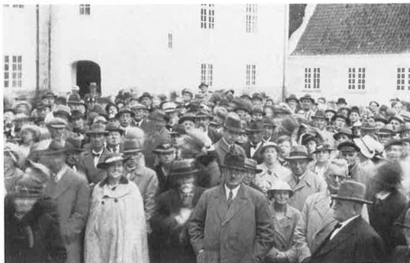
Historisk Samfund på udflugt til Harrislevgård. Billedet stammer fra en tid, hvor udflugter til fynske herregårde samlede 6–700 deltagere.

interesse. Overalt er der vist samfundets medlemmer en enestående gæstfrihed, og der er på disse udflugter åbnet adgang til mange kultur-skatte, som der normalt ikke er adgang til.