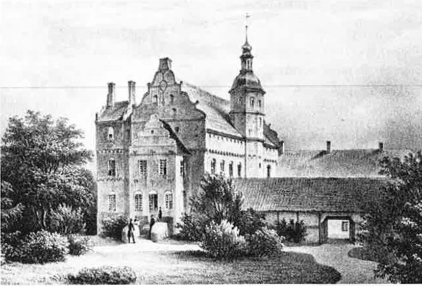
Ørbækklunde i midten af sidste århundrede. (Efter stik af Richardt og Becker, 1845).

og 4 skl.; sammentællingen i protokollen viser, at det var pr. gård ialt. 13 Landgilden udgjorde 2 tdr. byg og 2 tdr. havre pr. gård. I Sentved ca. 2 km nordøst for hovedgården ejede godset 4 gårde på hver 6–7 tdr. htk. Disse gårde var i modsætning til dem i Ørbæk by ikke hovydende, men betalte henholdsvis 24 rdl. i hoveriafløsning og landgilde, 10 rdl. i afløsning og 3 tdr. byg og 5 tdr. havre i landgilde, 7 rdl., 5 mk. og 2 skl. i afløsning og 4 tdr. 2 skp. byg i landgilde, og den sidste gård 6 rdl. og 5 mk. i afløsning og 1 td. 2 skp. rug, 3 tdr. byg og 2 tdr. 5 skp. havre i landgilde. I Æble, ligeledes i Ørbæk sogn, ejede Ørbækklunde 4 gårde på ca. 7–8 tdr. htk. Disse var ligeledes fritaget for naturalhoveriet og betalte hver fra ca. 19 rdl. til 24 rdl. incl. landgilde.