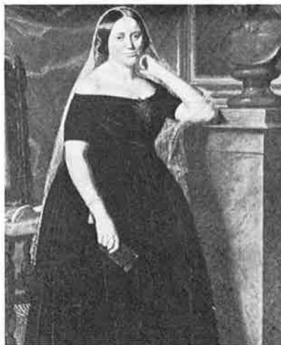
Portrætter af Louise Rasmussen. Billedet til venstre stammer fra midten af 1840'erne, hvor hun en tid boede i Næsby; mens billedet til højre er et udsnit af et maleri, som kongen lod udføre af sin brud kort tid efter brylluppet i 1850. Portræt af kronprins Frederik findes si. 11.