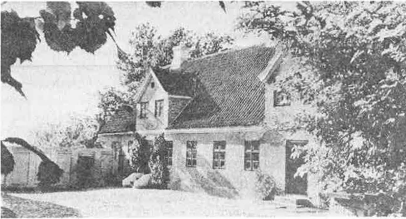
Søgård, hvis stuehus lå med den østlige gavl ud til Bogensevej umiddelbart syd for den nuværende Esso-tank. Stuehuset var opført i 1834, og det blev sammen med de øvrige bygninger nedrevet i midten af 1970'erne i forbindelse med Rismarksvejens forlængelse.