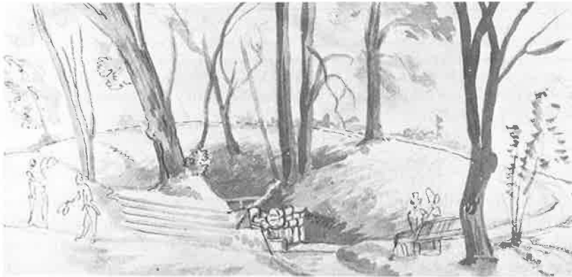
Akvareller af adjunkt J.H.T. Hanck af Karolinekilden i 1830'erne, hvor kilden og lunden dannede rammen om store folkefester på prinsessens fødselsdag, den 28. juni.

og man ved, at der en årrække udfoldede sig et broget folkeliv omkring kilden i Næsby omkring midsommertid.