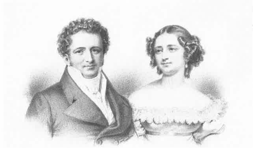
Kronprins Christian, den senere Christian VIII, og hans gemalinde, prinsesse Caroline Amalie af Augustenborg, der i 1831 navngav kilden i Bispens Lund mellem Næsby og Tarup.

anvendt med henblik på den tidsmæssige placering af hendes ophold på Søgården i Næsby.