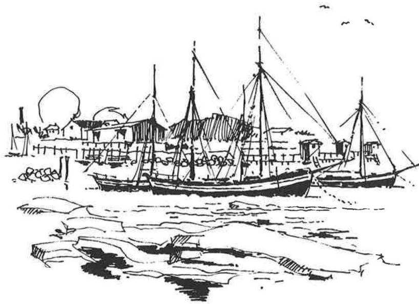
Om vinteren lå skibene opankret på vandet ud for Faldsled