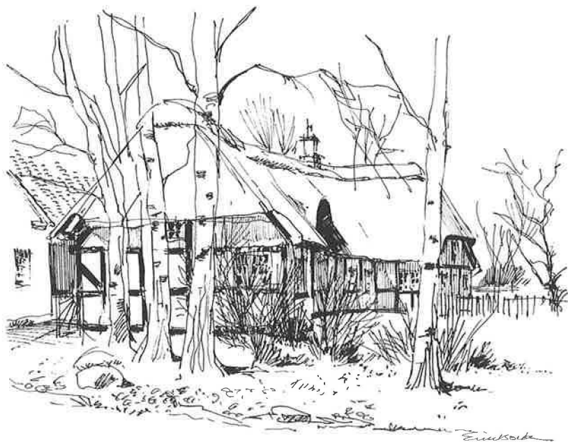
Også i byens gårde levede folk, der ernærede sig ved søfart (Tegning af Erik Bork, Faldsled)

Medens der de første år tit sejledes i ballast den ene vej, blev det efterhånden almindeligt at sejle med returlast hjem.