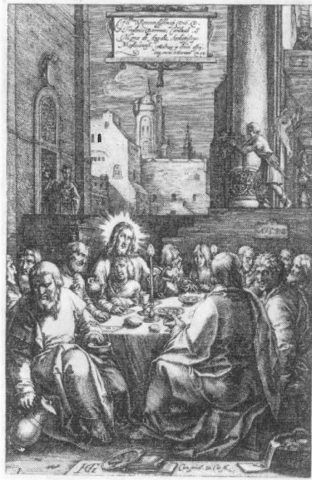
Figur 3: Hendrik Goltzius's stik fra 1598.

arbejder. I skifter fra såvel adel som borger finder man både bøger med kobberstik og enkelte stik, som må formodes at have hængt i ramme på væggene. To gange om året kunne man købe bøger og kobberstik i St. Knuds kirke, hvor der var opstillet boder enten inde i selve kirken eller, men det var ikke så fint, i våbenhuset. Det var dels lokale bogbindere og bogførere, dels udenbys som falbød billedbibles og andre gudfrygtige bøger (såvel som mindre tugtige, hvad kongen gjorde forsøg på at standse), mens kobberstik i enkeltstyk solgtes af papirhandlere. 5)