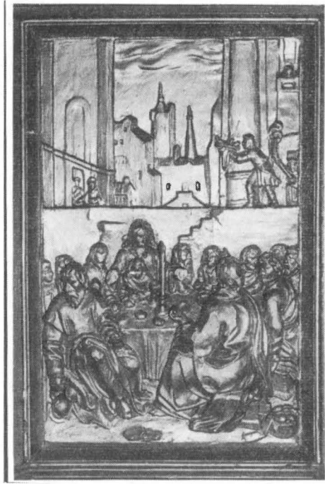
Figur 7: Prædikestolsfelt i Vor Frue kirke i Odense.

sidste nadver. Der er også andre afvigelser fra stikket. Personerne er omvendt fordelt på relieffet, hvor der i højre side kun er tre apostle, i venstre side otte. Ansigterne er ellers godt kendt fra andre arbejder af Anders Mortensen. Manden til venstre med kanden i hånden – som stikket viser ham – sidder ikke i denne stilling på relieffet, hvor kanden er flyttet over til manden, som sidder med ryggen til beskueren. Der er ikke noget lys på bordet, hvor der på et fad ligger et langt brød. Foran hver apostel har stikket en firkantet dækketallerken, men de findes ikke på relieffet. På både stik og relief sidder Jesus med et stykke brød i hver hånd. Det er Judas der sidder til venstre for fadet og kanden på gulvet; han er kende-