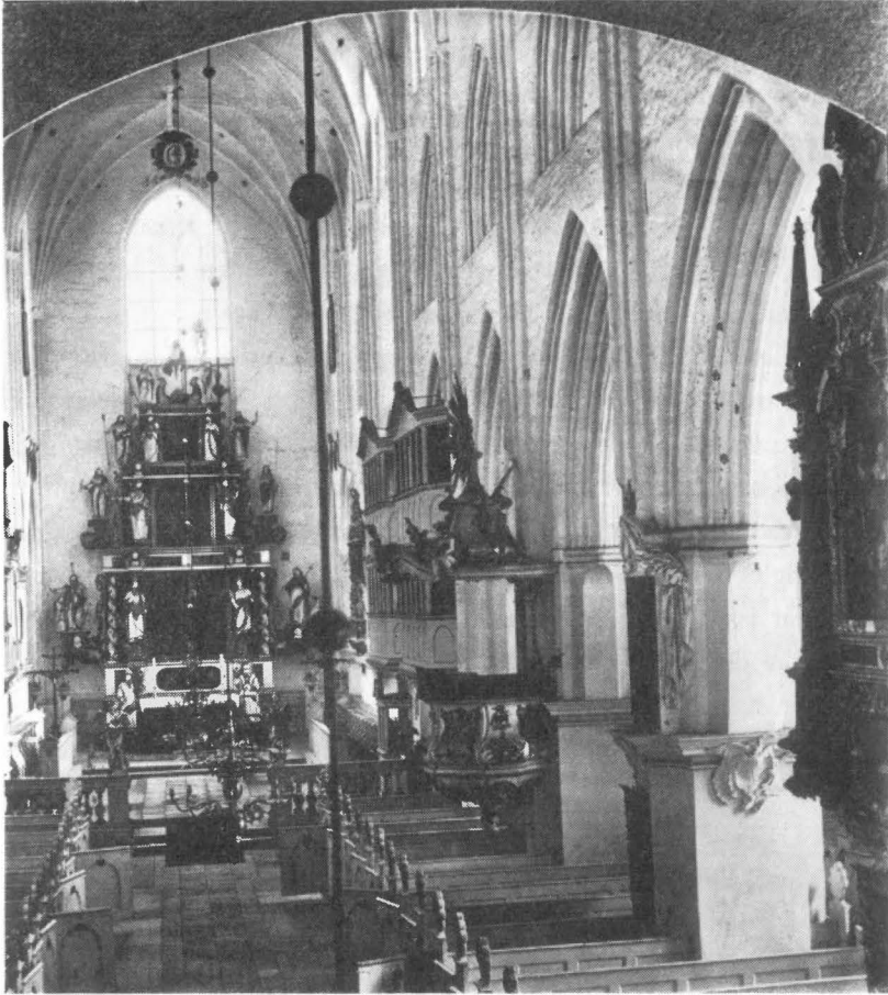
Figur 1: Et interessant fotografi af St. Knuds kirkes, Domkirkens, indre før 1885, mens Anders Mortensens store altertavle endnu stod i koret, som da lå i plan med skibet.