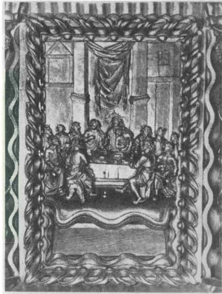
Figur 8: Prædikestolsfelt i Nyborg kirke.

tegnet ved pungen. På stikket sidder han som nummer to i højre side med pungen i venstre hånd.