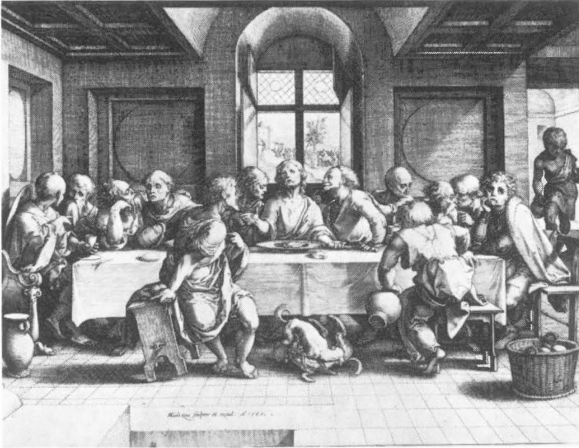
Figur 2: Henrik Goltzius's stik fra 1585.

et andet stik af samme kunstner og fjerde gang et stik af Hans van Lochom.