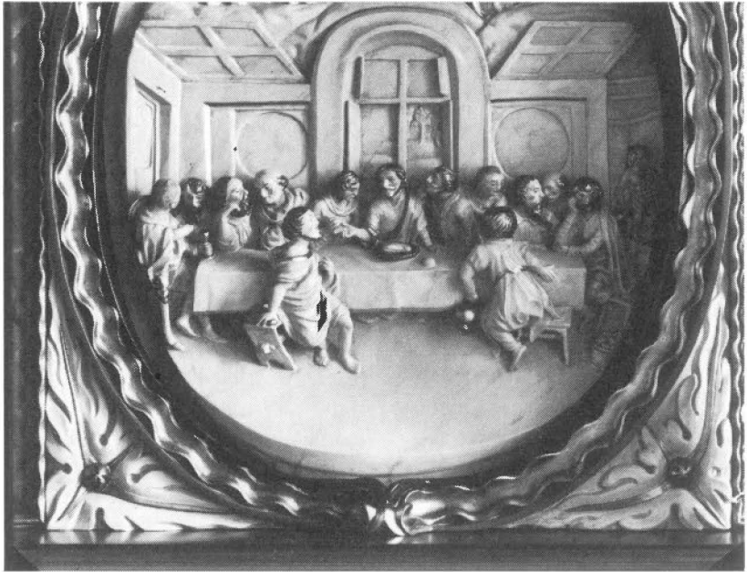
Figur 5: Relief på altertavlen i Tjæreborg kirke.

til højre foran bordet. På Goltzius-stykket sidder de to apostle imidlertid omvendt for Jesus.