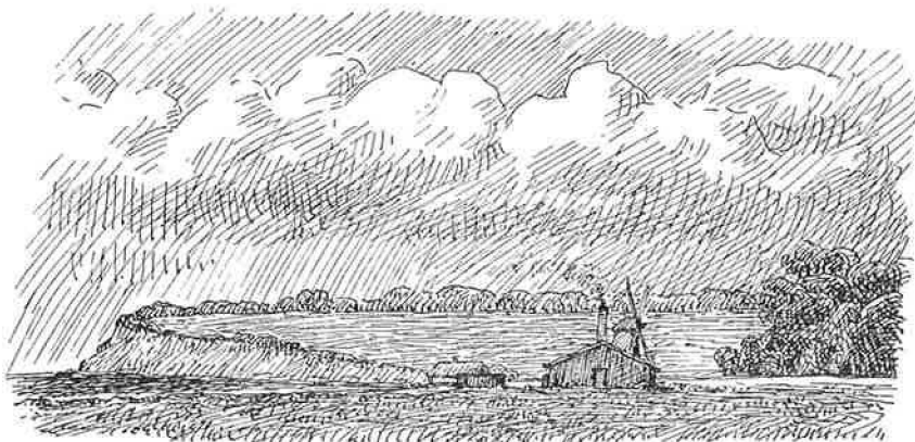
Fiskeguanofabrikken ved Kerteminde, nedbrændt 1872.

Pennetegning af Johannes Larsen, efter en Blyantstegning af I. P. Bless (Kerteminde Museum). I Baggrunden Lundsgaards Klint, i Midten det forlængst forsvundne Nissenborg Hus.