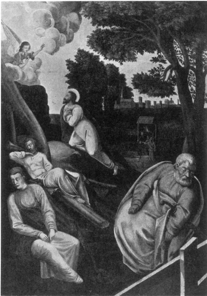
Det lille Maleri i Dalum