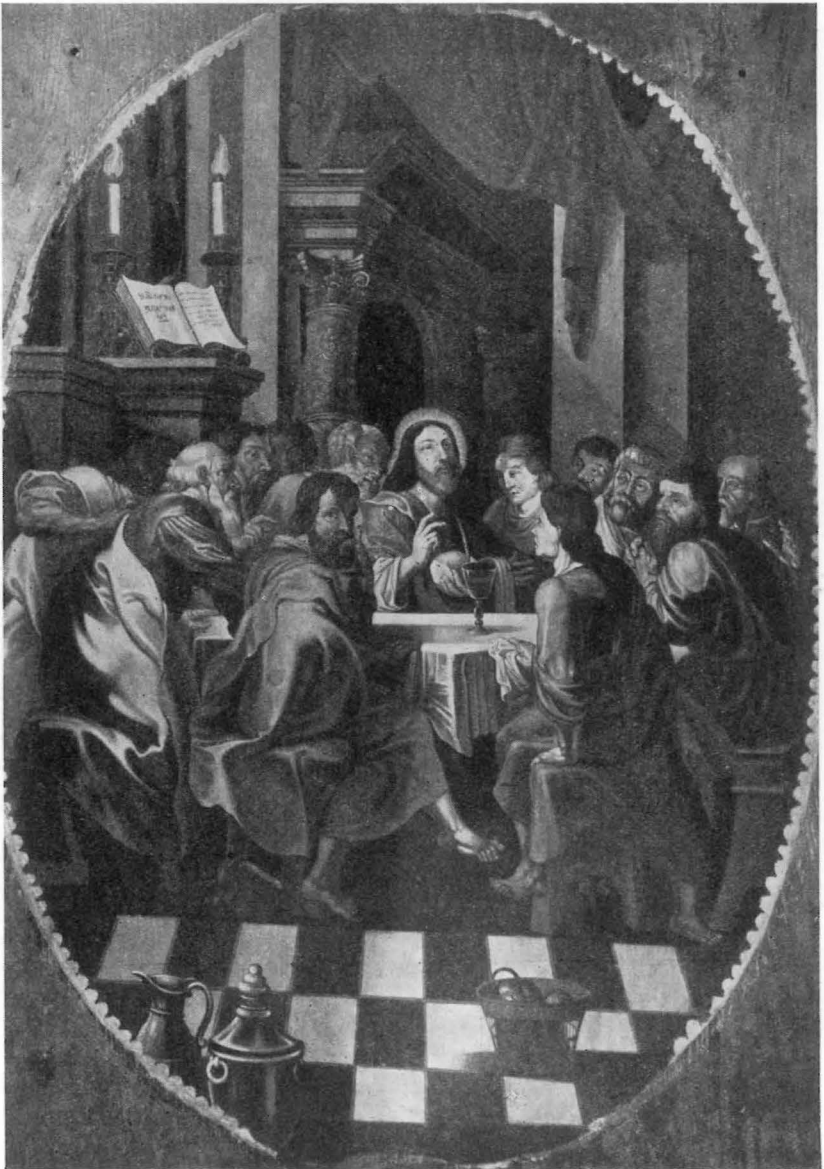
Alterbilledet i Dalum