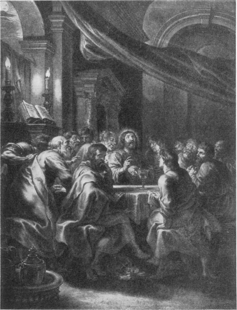
Boëtius à Bolswert's Stik

der Vinduet, der hos Rubens lægger Haanden blidt paa Ryggen af sin skaldede Fælle, stemmer hos Boëtius en kraftig Arm mod hans Ryg, mens den gamle selv griber krampagtigt om Bordkanten. Det er, som om Ekstasen er søgt forstærket. Bibelens Tekst er blevet hebraisk.