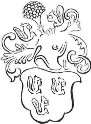
Fig. 1. Friis'ernes vaaben

Johan Friis til Hesselager (1494-1570) var gennem tyve aar som kansler „Danmarks mægtigste mand og virkelige styrer“. 1 Hans fædrenegaard var Hesselager , som han genopbyggede, efter at den under Grevens fejde var gaaet op i luer. Han byggede den som en kraftig og trodsig fæstning med taarn og vægtergang til forsvar og omgivet af en beskyttende vandfyldt grav. Den smukke indskrifttavle angiver genrejningsaaret til 1538, det kan dog næppe passe