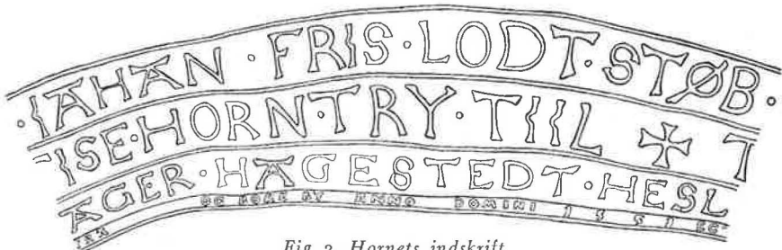
Fig. 3. Hornets indskrift