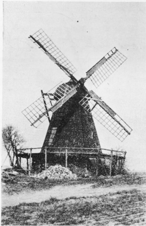
Brudager Mølle, Brudager Sogn

I Kong Christians V Danske Lov omtales de kun ganske flygtigt; men 1688 udstedtes gennem Kommerciekollegiet Bestemmelsen om Mølleskyld for Vindmøller, denne Afgift kendes for Resten meget tidligere; thi i Kong