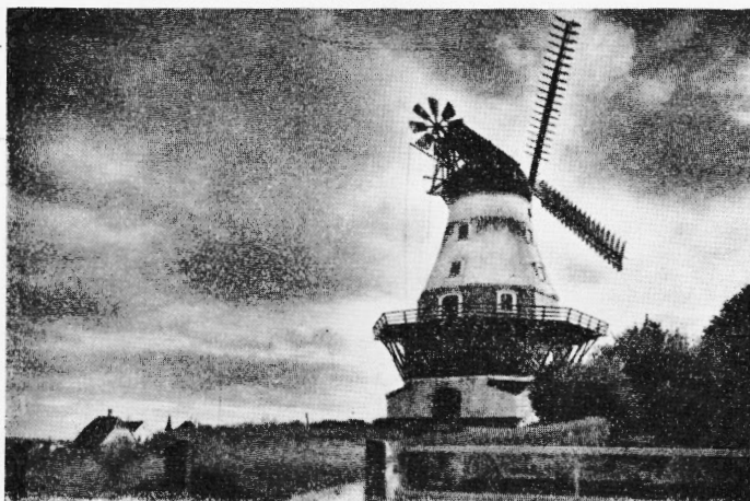
Christiansmøllen paa „Kongebakken“ v. Svendborg

I ældre Tid havde alle Møllevinger Sejl, de var spændte paa Vingerne og kunde rebes alt efter Vindens Styrke, for at Møllen ikke skulde løbe løbsk og risikere at blive