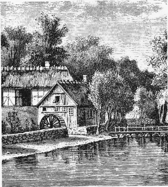
Venteposemølle, Bregninge Sogn, Taasinge.

I mange af vore Byer træffes Stednavne, der minder