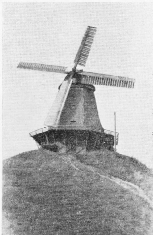
Bjærgby Mølle, Tullebølle Sogn

over, at de har lidt den triste Skæbne, at maatte vige for Motorer og Elektriciteten, kun Christiansmøllen drejer endnu rundt, og pryder Landskabet, hvad saa at sige enhver Vindmølle gør.