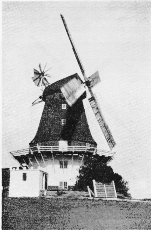
Tranekær Mølle, Langeland

fra Svikstillingen ved Hjælp af et Haandsving, der igen virker paa den store Bom, der naar helt op til Hatten, Bommen hedder i Møllesproget „Svansen“, og det siger sig selv, at det er ulige besværligere, navnlig naar Vin-