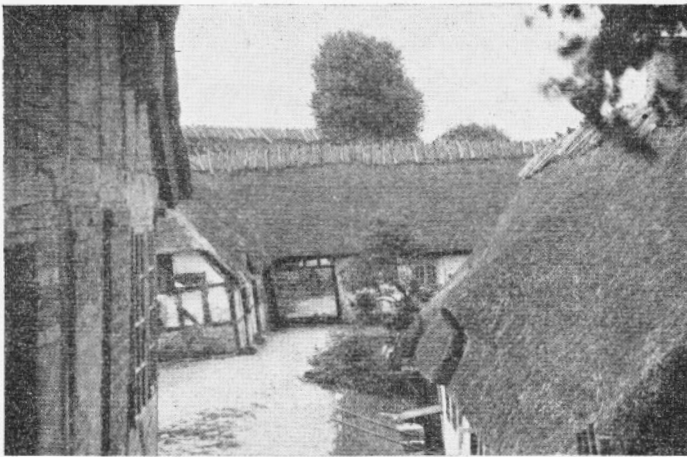
Kaleko Mølle, Diernisse Sogn

1356 interesserede sig meget for saadanne Anlæg, og lod anlægge Diger og Dæmninger samt sørgede for, at Møledamme udgravedes. Allerede i hans Tid nævnes Tang-aamølle 1361 og Urtemølle ved Hvidkilde 1372, og muligvis kan Skaarup Skovmølle datere sig ligesaa gammel. Gundestrup Mølle i Hundstrup findes nævnt 1418, Lydinge i Krarup 1438. Den 26. Marts 1597 brændte den anden af Hundstrup Vandmøller en Paaskeaften, nemlig Elleskovsmøllen. I Aaret 1610 forekommer følgende Møl-