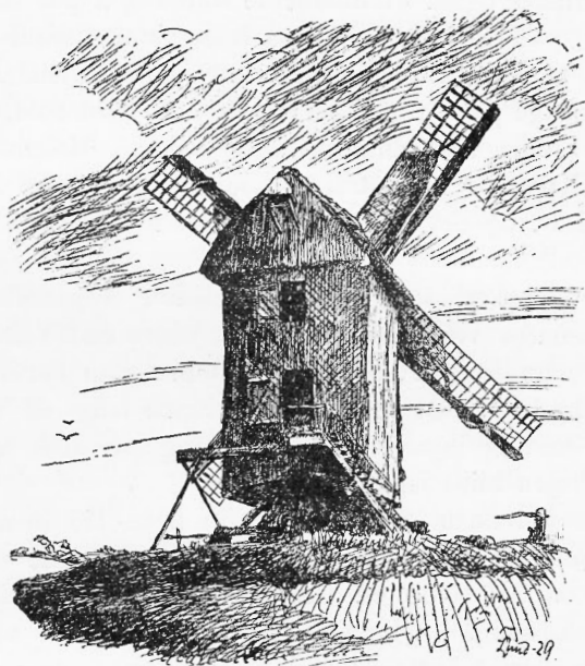
Stubmøllen paa Lyø

men er snart forsvundne i Landskabet, de faa, som er bevarede, er saa at sige Museumsgenstande, enkelte er fredede. Ved en Stubmølle forstaar man en mindre ofte ret primitiv Mølle med Vinger, den er indrettet saaledes, at den ved Hjælp af en fra Møllens underste Delskraat udstaaende Bjælke, kan dreje sig om en Pæl, hvorpaa selve Møllen hviler. Den skraa Bjælke kaldes „Møllensvø-