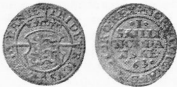
Frederik II.s Skilling 1563.