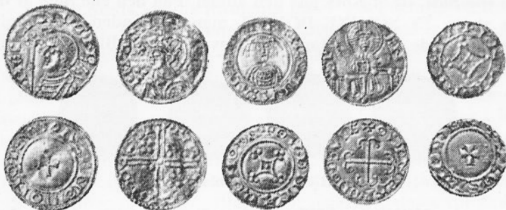
Penninge, slagne i Odense i det 11. Aarh.