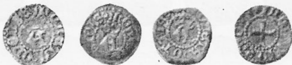
Erik af Pommerns Kobbersterlinge.

stort Antal Mønter. Den fordums Ejer af denne Pengesum havde fyldt en Hose eller Strømpe med disse Mønter og lagt den ned i Jorden. Og maaske er der kommet en Ildebrand, som har for-tæret dette Omsvøb, hvad det nu har været, og omdannet det indpakkede Kobber til en Masse, der var formet som en Fod, saaledes at man næppe kan adskille og ubeskadiget løsne noget fra Resten. Men blandt mange, som blev rensede for Smuds og Ir, har jeg bemærket og tydeligt nok iagttaget paa dem alle et Bogstav E, skrevet med gammeldags Munkeskrift og kronet paa den ene Side, og et Kors paa den anden. Paa den ene Side af dem alle staar: IN NOMINE DOMINI, men den anden Side angiver Byen, hvor de enkelte Mønter er blevet præget. Blandt disse kan