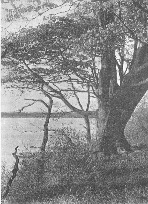
Bøgetræ ved Stranden, Parti fra Taasinge.