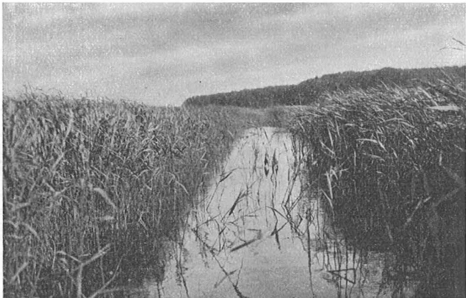
Rørskov med Kanal i sydfyensk Mosedrag.

Dernæst blev der givet Besked om det Fugleliv, der er knyttet til de forskellige Landskabsformer. Der fremvistes en Række Billeder med Æg og Un-