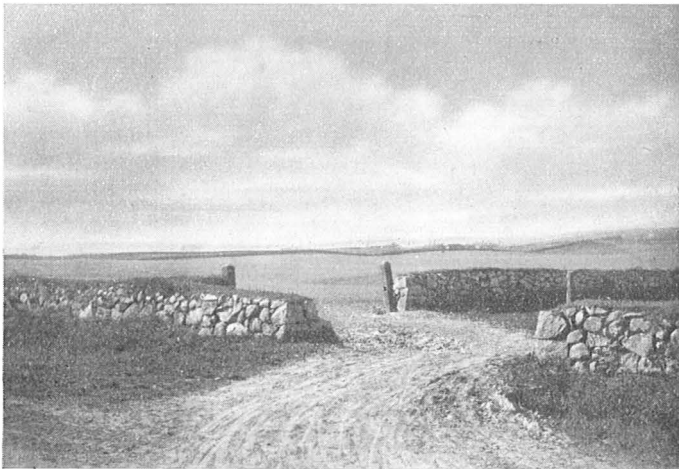
Sydfyenskt Marklandskab med Stengærder.

en Udflugt igennem en stor Del af Sydfyen, og viste dem Skønheden og Ejendommeligheden ved de forskellige Landskabsformer. Man saa Skoven i Sommer- og Vinterdragt, Bøgehøjskoven med Anemone-tæppet, Bækken, der rislede igennem Ellekrattet, og