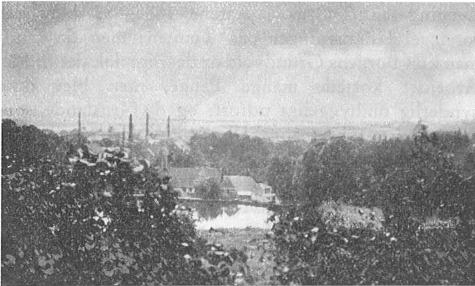
Udsigt fra Ørkild Borgplads.

opbevaredes der. De gode Svendborgere glemte nu heller ikke at gøre det grundigt af med Ørkild By; saa havde man den Konkurrent fra Halsen.