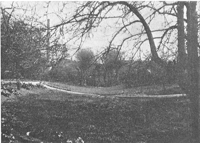
Levninger af Volde og Grave i Krøyers Have.

Paa Ørkilds Borgplads er der nu desværre kun nogle Fundamenter tilbage; men Beliggenheden er