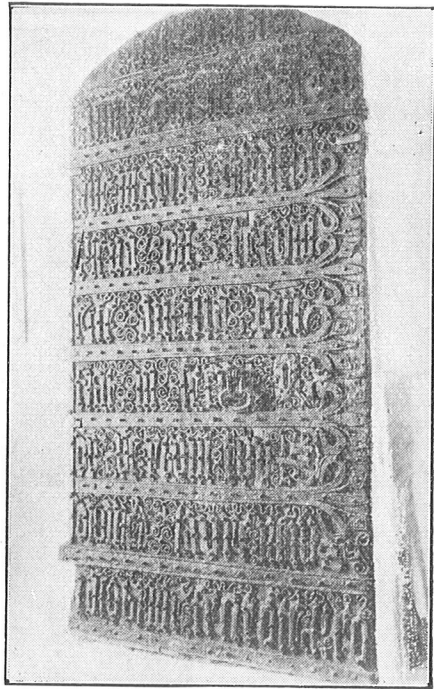
Den gamle Kirkedør i Indslev Kirke.