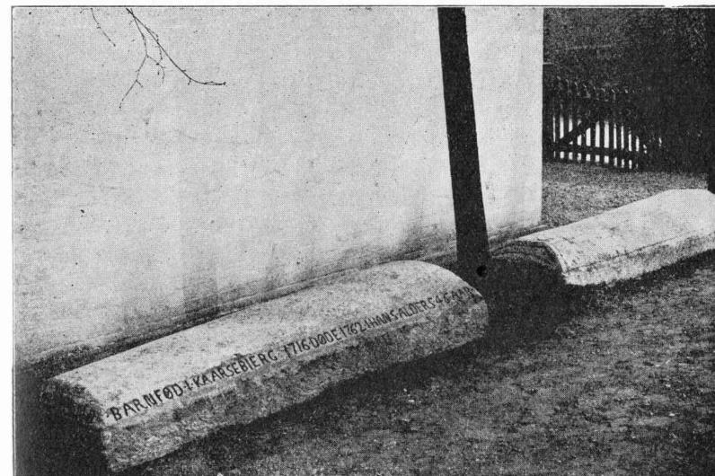
Monumenter paa Ubberud Kirkegaard stammende fra Korsebjerg