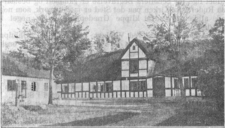
Søndersø Præstegaard set fra Gaarden.