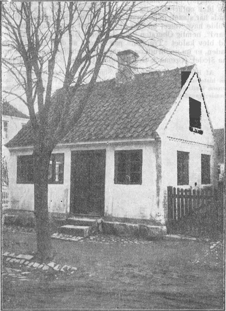
Den gamle Toldbod, som nu er forsvunden.