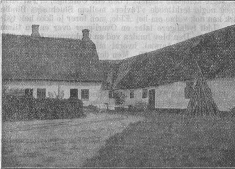
Nørre Aaby Præstegaard.

Den østlige Ende af Stuehuset og Kapellanboligen.