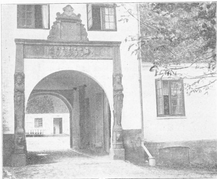
PORTEN TIL HARRITSLEVGAARD.