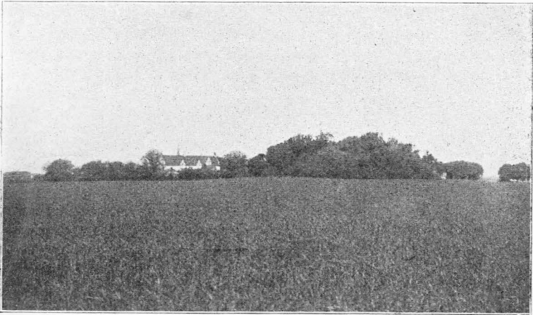
HARRITSLEVGAARD OG LAADNE HØJ.