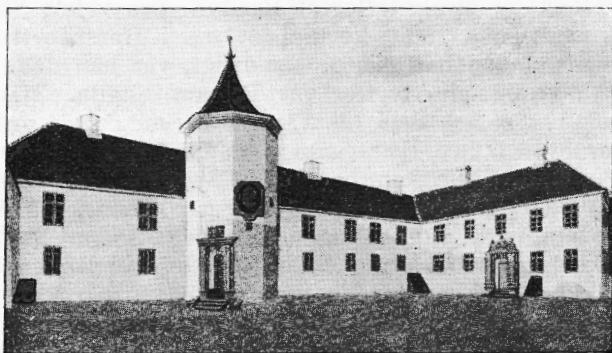
Dallund, set fra Gaarden, ca. 1820. Gouachebillede paa Nationalmuseet.

og fantastisk ved sig og øvede sin Indflydelse paa Bondens Fantasi, den Evne, som netop da var særlig udviklet; thi man begreb jo kun saa lidt med Forstanden. — Der er jo sikkert nok ogsaa udspillet mangt et Drama bag Dallunds tykke Mure, og Sagnet siger da ogsaa, at to unge adelige Damer, den ene bedre end den anden, døde med kort Tids Mellemlum og blev begravet under Kapellets Gulv. De forsvandt i alt Fald hurtigt, og man mente, de var indemuret i Kælderen. Ved Restaureringen nu for nylig fandt man dog intet Tegn til hemmelig Begravelse under Kapellet. Der