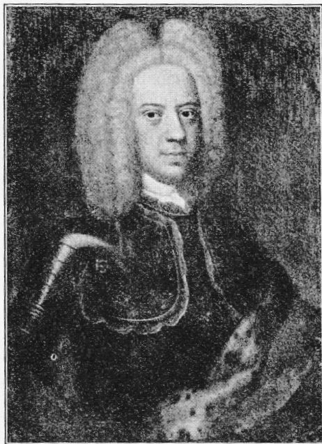
Oberst Günther Didrik v. Finecke, † 1729. Maleri af Balth. Denner paa Arreskov.