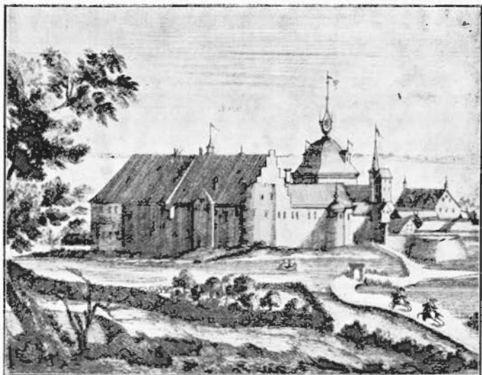
Nyborg Slot 1659.

Forsvarsmidler omtales en halv Slange og to Falkonetter af Kobber, 2 Skarpentiner, hver med 2 Kamme, 9 Jernhager, 17 Talliehager, 3 Stenbasser med 12 Kamme, 4 Tønder Slangekrudt, 1 Tønde Kørnekrudt, \frac{1}{2} Tønde Svovl.