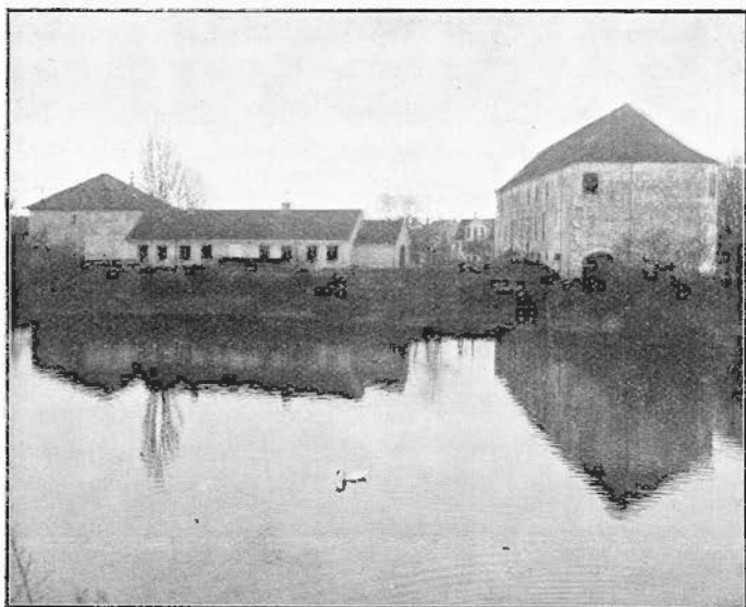
Nyborg Slot 1910.

Bygningsdistriktet og Nyborg Kommune skulde afholde de fornødne Udgifter til en Afgravning ved Slottet, for at de gamle Fundamenter kunde blive paaviste og opmaalte, og Slottets Udstrækning derigenem paavist. Til Skade for Sagen skete der et Personskifte indenfor Bygningsdistriktets Officerer, ligesom Midlerne ikke var tilstede i tilstrækkelig Mængde,